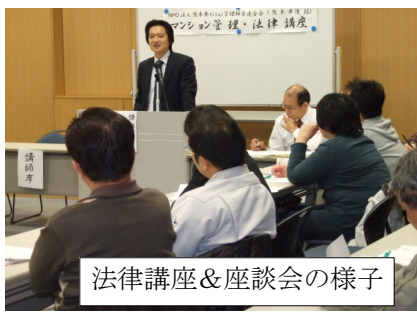
法律講座&座談会の様子

など様々な事例の考え方を説明いただいたが、基本的には管理組合で決めて、管理規約や細則で規定すればいいことである。(あくまでも前述の基本 の考え方に従って)